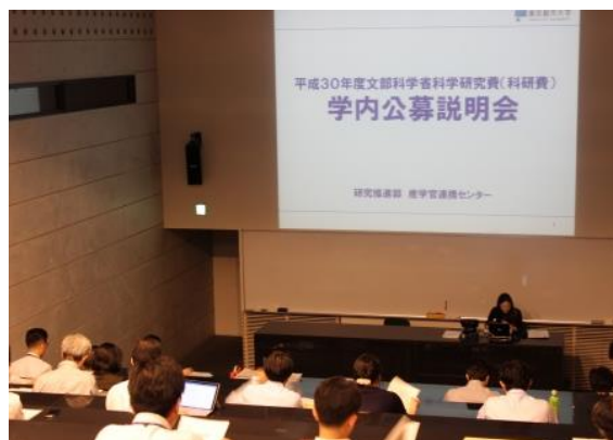
学内公募説明会会場の様子(SC)

今年度も学長及び各学科による査読を実施する予定です。当センターへの応募書類の提出締め切りは10月10日（火）17時となっておりますので、是非学内の査読制度を利用し、科研費の獲得を目指してください。