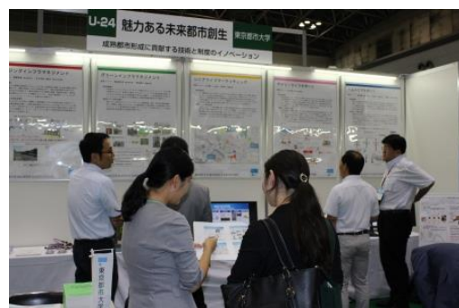
大学組織展示ブースの様子